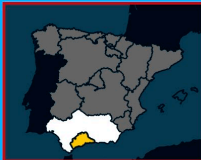
LOCATION IN SPAIN